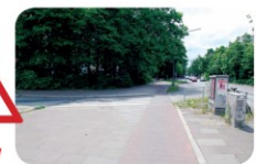
Alsenplatz/Eimsbütteler Str. Vorsicht am Zebrastreifen. Hier musst du auf abbiegende Autos achten!