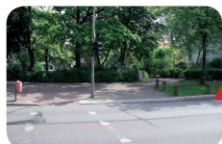
Alsenstr./Missundestr. Achte auf den Radweg! Die Radfahrer kommen aus beiden Richtungen und fahren sehr schnell. Sie haben Vorfahrt!