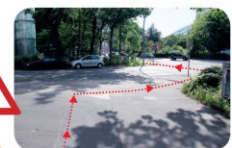
Langenfelder Str./Alsenstr. Hier solltest du den Zebrastreifen benutzen! Auch hier muss man mit schnell einbiegenden Fahrzeugen rechnen und sehr vorsichtig sein!