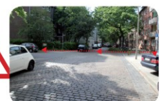
Langenfelder Str./ Sommerhuder Str. Überquere die Straße auf Höhe der Langenfelder Straße 25! So bist du gleich auf der richtigen Seite, um die Schule zu erreichen! Quere die Straße so, dass du sie einsehen und auch Fahrzeuge gut sehen kannst!