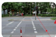
Alsenstr./Gefonstr. Der Radweg ist wegen einer Hecke nicht gut einsehbar. Achtung! Die Radfahrer fahren hier besonders schnell! Und: Sie haben Vorfahrt!